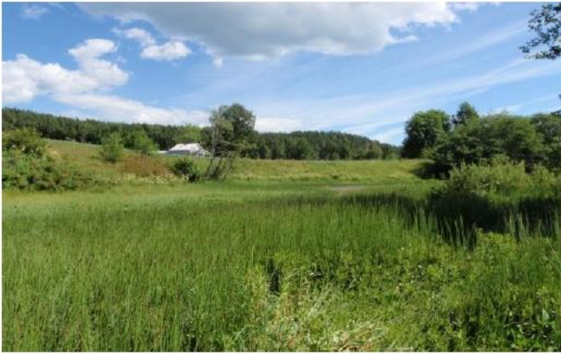
Bilde 1 - Gjenfroing (eutrofiering) i Kampåa